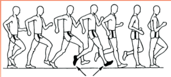
Fehler weil kein Bodenkontakt

Gehen ist eine olympische, leichtathletische Disziplin, bei der im Gegensatz zum Laufen der Fußkontakt mit dem Boden ständig erhalten bleibt. Weiters muß das Knie beim Aufsetzen bis zum Erreichen der Körpermitte bei der Schrittbewegung gestreckt sein.